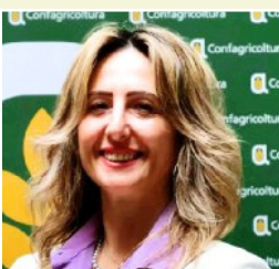
Responsabile Credito, Finanza e Rapporti Istituti finanziari - Politiche Creditizie